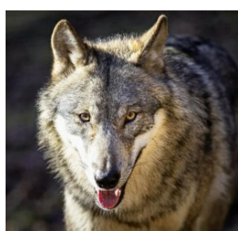
Mehrere Personen meldeten das kranke Tier: Innert einer Woche wurden zwei Wölfe erlöst.

Das Tier sei zunehmend auch tagsüber beobachtet worden. Dank einer verstärkten Überwachung sei es der Wildhut gelungen, den Wolf beim Flugplatz Bad Ragaz zu finden und zu erlösen. «Der Wolfsrüde war mutmasslich durch die